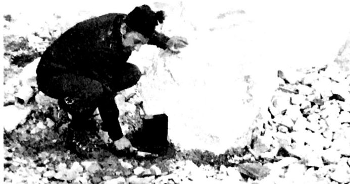
Un alpinista posa la prima cassetta sul Jôf di Miezegnot.

Nel corso dell'annuale incontro tra gli alpinisti delle regioni confinanti della Carinzia, della Slovenia e del Friuli-Venezia Giulia, nacque tre anni fa l'idea di un'iniziativa che potesse maggiormente favorire l'amicizia e la conoscenza fra le popolazioni vicine. In questi giorni, i soci del Cai stanno appunto portando a termine la realizzazione di questa iniziativa. La sezione di Gorizia del Club alpino italiano ha impegnato, a questo scopo, ogni sua risorsa, sostenuta dai contributi della regione e in collaborazione anche con i club alpini della Slovenia e della Carinzia.